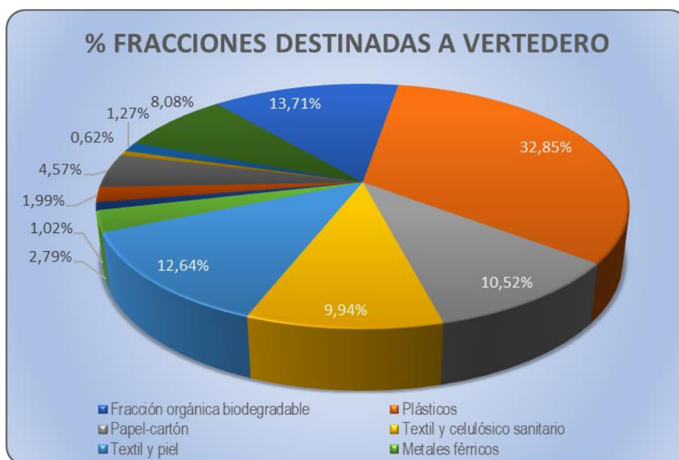
Gráfica 3: Reparto por tipologías de materiales del rechazo del tratamiento de la fracción “resto”, eliminados en vertedero en 2022.