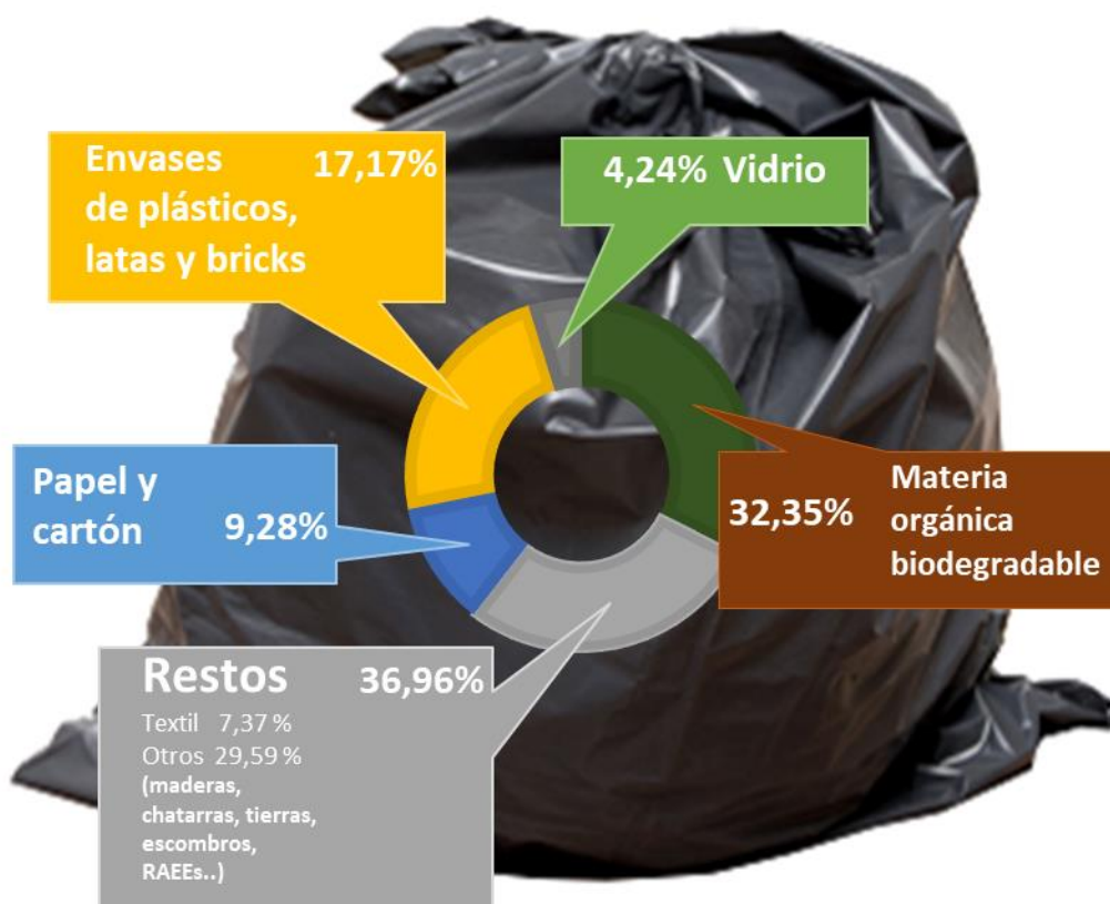
Composición de la bolsa gris de residuos municipales en 2022.

La composición media de la bolsa de basura gris correspondiente a la fracción “resto” de residuos municipales en 2022, dividida entre las cinco fracciones principales (materia orgánica, envases ligeros, papel y cartón, vidrio y resto) se muestra en el siguiente gráfico: